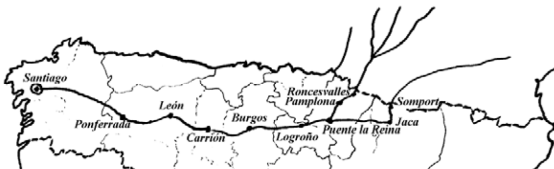
Fig. 3: El Camino Francés

caso, tras atravesar Tiermas con sus baños reales "... siempre calientes " 9 , población hoy abandonada, se alcanza el monasterio de Leyre, Yesa y Liédena . Aunque en la Guía no hay ninguna indicación al respecto, es muy probable que numerosos peregrinos se dirigiesen hacia Sangüesa , villa que, en el siglo XII, estaba siendo repoblada gracias a Sancho Ramírez y Alfonso I, donde podemos encontrar claras evidencias jacobeanas, como la iglesia de Santiago. Desde aquí el camino se dirige a Monreal , recorre pequeñas poblaciones al pie de la sierra de Alaiza como Yárnoz, Otano o Tierbas , pasa junto a la interesantísima ermita de Nuestra Señora de Eunate y, finalmente, llega a Obanos donde confluye con el ramal navarro; desde este momento, el Camino Francés será uno, con pequeñas variantes, hasta llegar a Santiago.