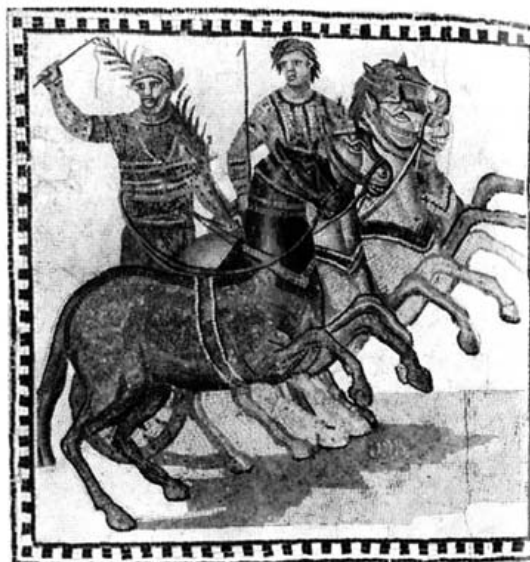
Cuádriga vencedora y cuádriga con auriga y iubilator . Museo Arqueológico Nacional, Madrid.

caballo. La caja del carro es naviforme. La casaca que viste el auriga es de color azulado, indicando posiblemente que pertenece la cuádriga a la facción véneta. Dos caballos llevan amuletos triangulares sobre el collarón, como augurio de buena suerte en la carrera. Todos los museos del mundo conservan una gran cantidad de estos amuletos en bronce, cuya significación y clasificación fue hecha hace ya años por Deonna y en España por Clarisa Millán. Una ramita adorna también la frente de los caballos. El artista ha sabido dar a la cabeza de los équidos una extraordinaria vivacidad, propia de la excitación de la carrera. Igualmente están muy bien logrados los gestos de triunfo en los dos personajes que marchan sobre el carro. Una composición muy semejante se repite en el mosaico, también con escena de carreras de circo, conservado en el Museo Arqueológico de Barcelona, bien estudiado por A. Balil y fechado por este autor entre los años 310 y 325. Sin embargo, creemos que el mosaico madrileño es de fecha posiblemente anterior, como parece desprenderse bien claramente del