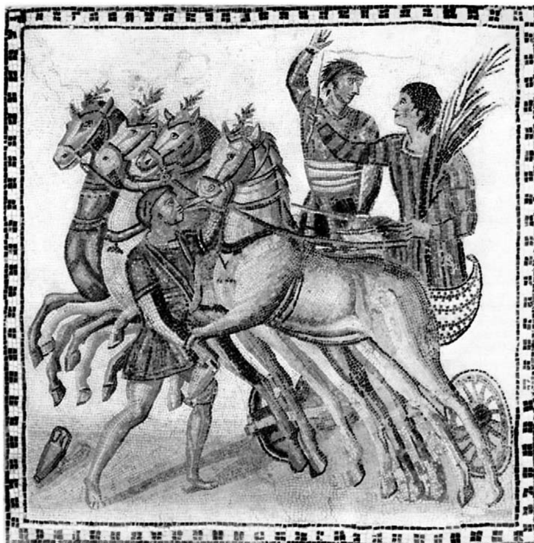
Cuádriga con auriga. Iubilator y sparsior . Museo Arqueológico Nacional.