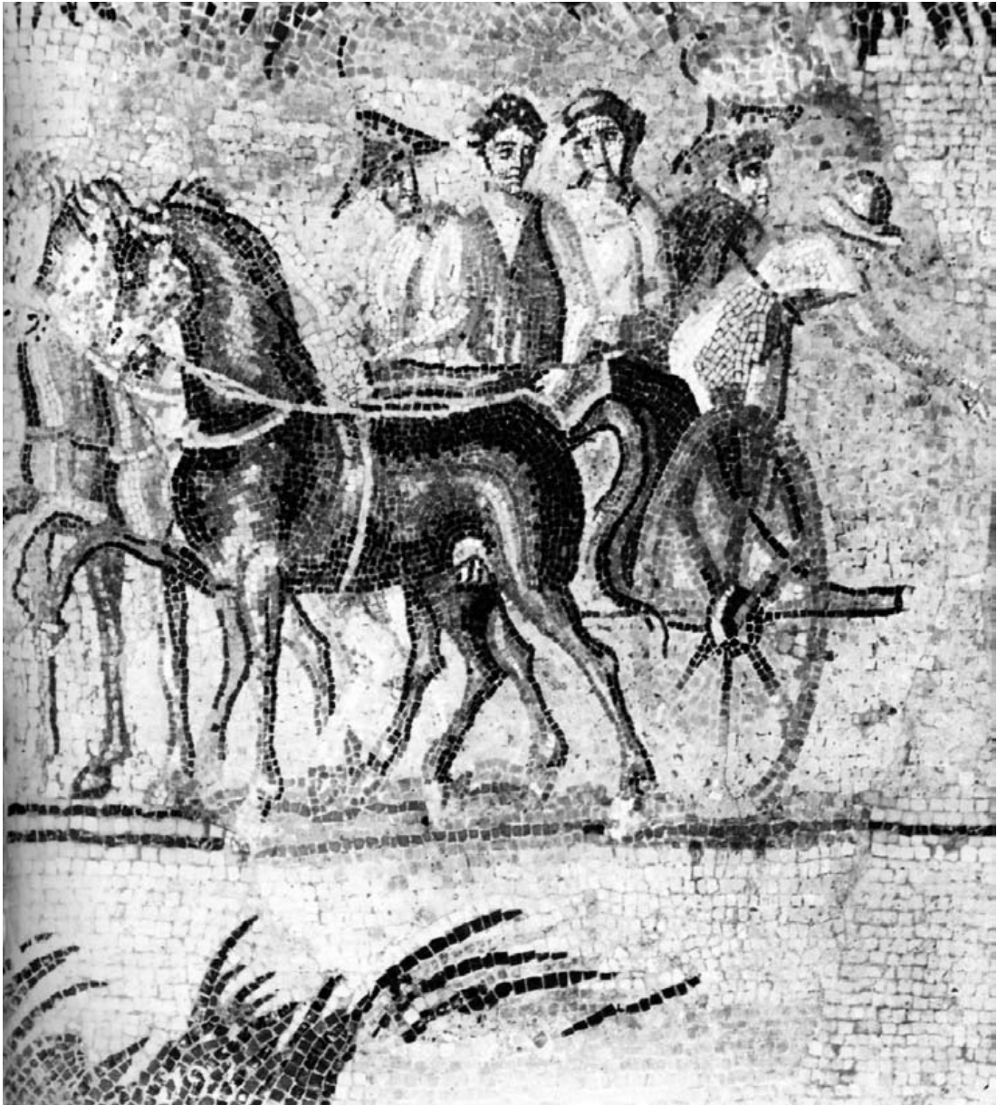
Carro. Época del renacimiento. Museo Arqueológico Nacional, Madrid.