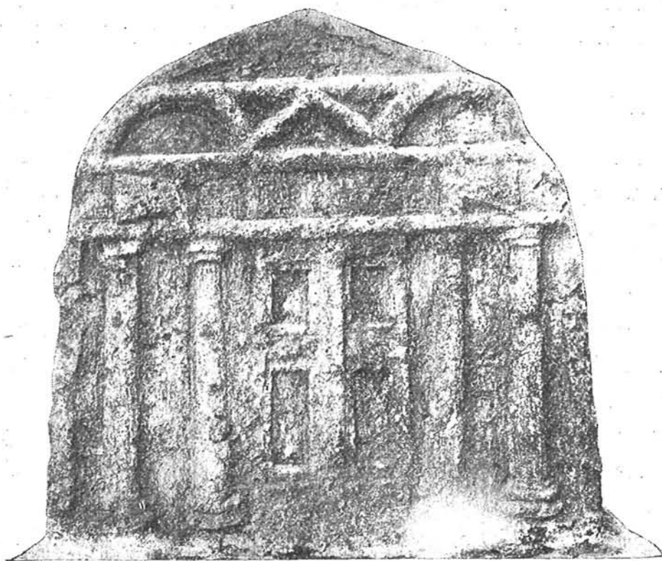
Fig. 1. a Estela romana.

El monumento romano de referencia es una estela labrada en