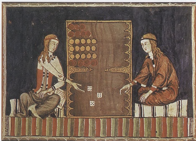
"a joc de daus vos acompararé" (Ausiàs March). Miniatura del ms. fet a Sevilla el 1283 dels Libros de ajedrez, dados i tablas , d'Alfons X el Savi. Mostra dues dones jugant al "tric-trac" (Biblioteca del monestir de El Escorial, Madrid).

L'ambigüitat, allò que Estellés no diu, dona al poema un doble sentit verament eficaç, el recurs de l'exemple i aquest intent d'oferir algunes claus de lectura fan pensar, però, que els millors amants, en una lectura més subjectiva, podrien ser també el pare i el fill. L'herència, doncs, no és només poètica sinó vivencial també... "car d'amants com nosaltres en són parits ben pocs." El llibre d'Estellés continua després del poema que ens ocupa amb nous i diversos exemples d'amor, un amor de vegades "tan gran com la Seu de Mallorca", un amor "inserit, quina cosa, en la història!".