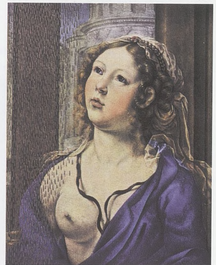
"Dánae", de Jan Gossart, Mabuse, detall (L'Ermitage, Sant Petersburg).

com no t'he de recordar, com no he de fer-te un lloc ací en aquest llibre, Isabel, filla meua, amarga i dolça filla meua?