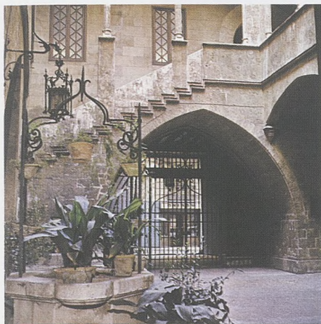
Patí gòtic dels Almiralls d'Aragó, València.