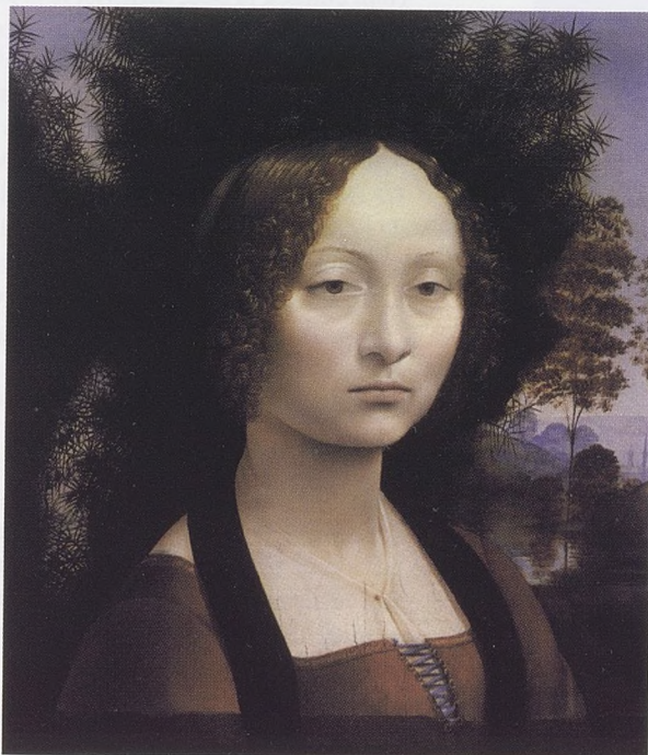
"Retrat de Ginevra dei Benci", de Leonardo Da Vinci (National Gallery, Washington).