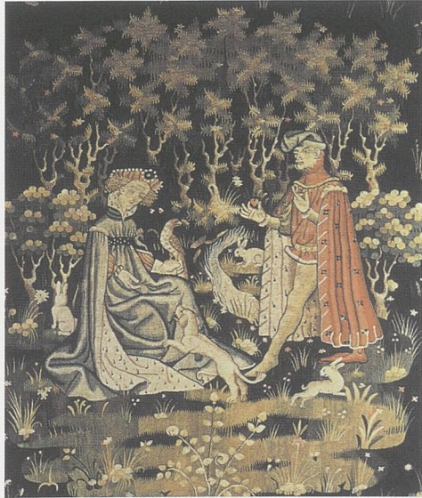
"L'ofrena del cor", tapis francès del segle XV (Musée de Cluny, París).

4 RIQUER, Martí de: Història de la literatura catalana . vol II, p. 545. Barcelona, 1980.