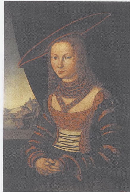
"Retrat d'una dona", de Lucas Cranach el Vell (Akademie der Bildenden Künste, Viena).

Ja la edat a mi no és cominal. Seré jutjat de tots per galant vell i a dones plau l'hom quan és jovencell: totes són carn i en carn és llur cabal. Tant quan a ço, recapte els donaré: dels membres só bé proporcionat, mas és lo mal que l'ull tinc ja ruat i en llur esguard vell me reputaré. Moltes raons bastament los diré, mas no iré per los carrers cantant: a dones plau l'hom qui va folleiant.