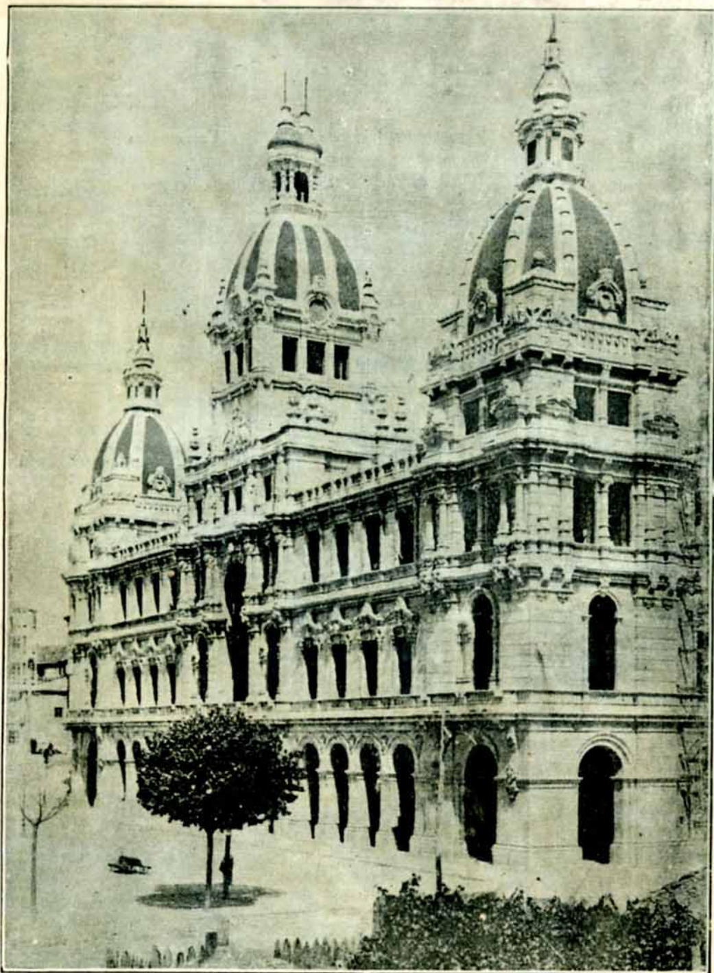
LA CORUÑA. PALACIO MUNICIPAL.