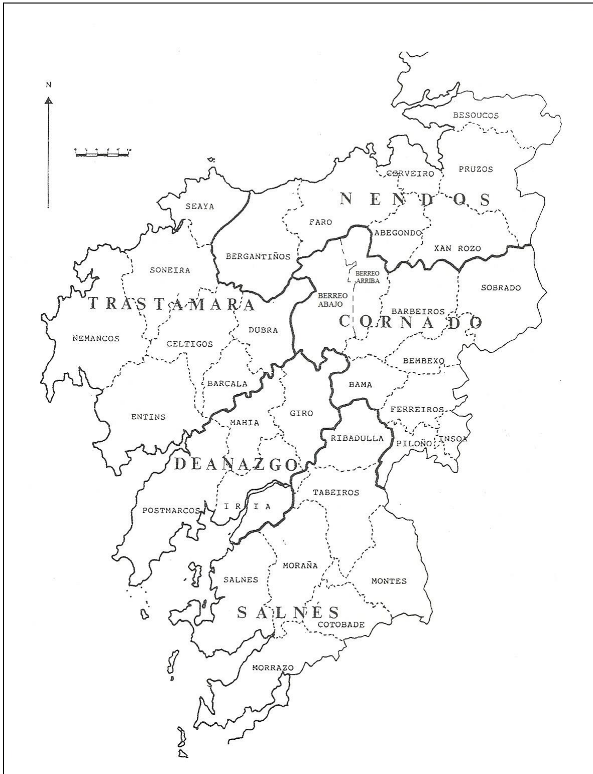
Mapa 2: Arcedianatos y arciprestazgos en la diócesis compostelana