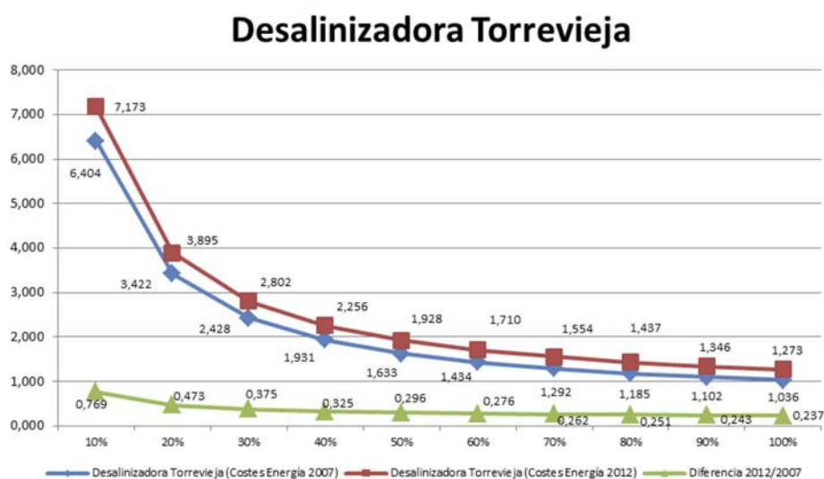
Figura 2. Coste unitario de producción de la Desalinizadora de Torrevieja según capacidad de producción empleada

Cifras en €/m 3 .