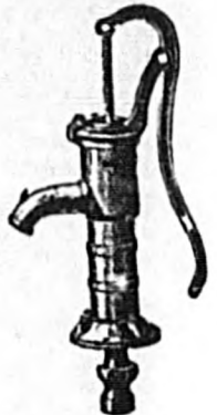
Bomba para cisterna N.º 1 y 2. Precio: 80 y 90 ptas.

NOTA IMPORTANTE. — Esta casa acaba de recibir una nueva remesa de máquinas Norteamericanas para picar carne y embutir, de 15, 25 y 55 pesetas una.