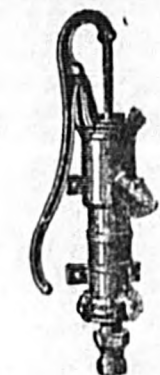
Bomba aspirante. DE PARED. N.º 0, 1, 2, 3, 4, 5. Precio: 16, 18, 20, 24, 30, 34 ptas.

ALAMBIQUES y aparatos destilatorios PALAS DE ACERO Y HORQUILLAS ARADOS DE VERTEDERA VINADORAS Tijeras para podar LEGIADORAS