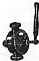
La Aleoría. N.º 0, 1, 2, 3, 4, 5, 6, 7, 8. Precio: 28, 32, 45, 55, 65, 80, 110, 130, 150 ptas.