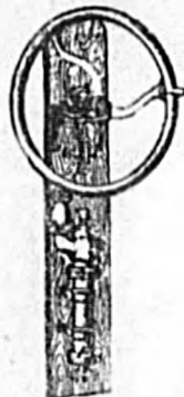
Bomba aspirante IMPLENTE PARA POZOS Y CISTERNAS. N.º 1 y 2 Precio: 100 y 125 ptas.