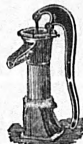
Bomba aspirante jarro. N.º 0, 1, 2, 3, 4, 5. Precio: 16, 18, 20, 25, 30, 34 ptas.