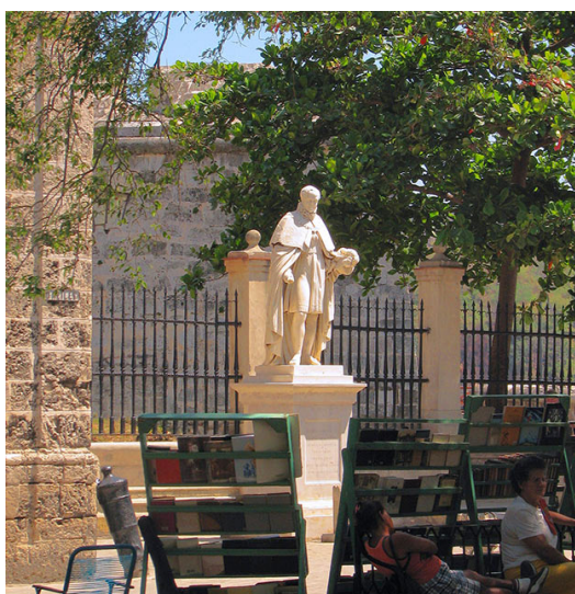
Fig. 7. Estatua de Fernando VII, calle O'Reilly, La Habana

Fecha de envío / Submission date: 12/04/2019