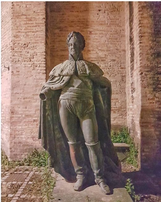
Fig. 3. Posible copia de la estatua de Fernando VII del monumento levantado en la Plaza de Palacio en Barcelona, por P.-J. Chardigny. Museo de Santa Clara (Sevilla)