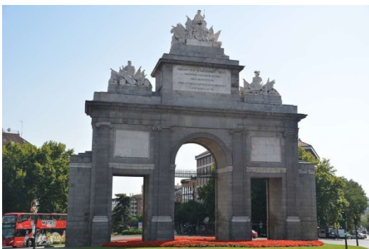
Fig. 4. Puerta de Toledo (Madrid)