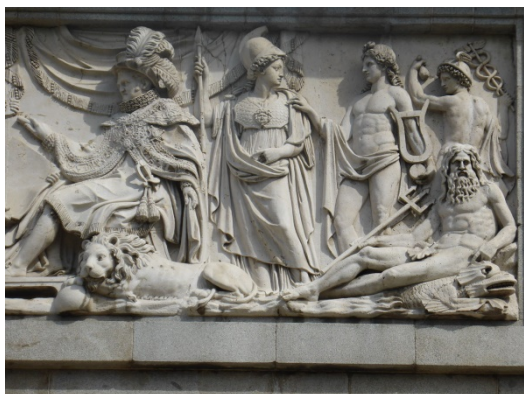
Fig. 5. Detalle del friso de la puerta de Velázquez, Museo del Prado