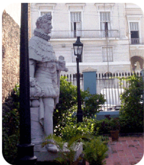
Fig. 6. Fernando VII, por I. Peschiera. Museo Palacio de Junco, Matanzas (Cuba)