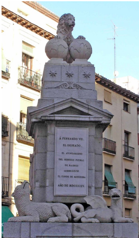
Figura 1. Monumento en el barrio de La Latina (“La Fuentecilla”) (Madrid)