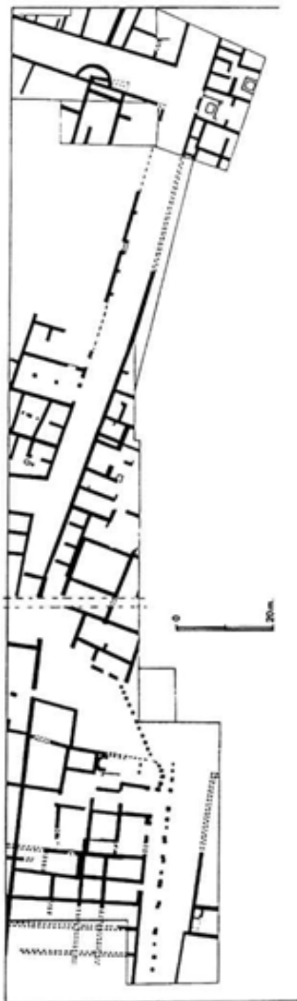
Fig. 2.- Sector de Vareia descubierto por las excavaciones entre 1988 y 1990.