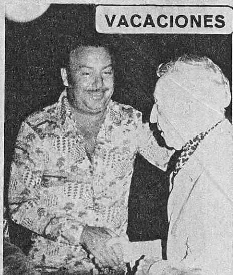
El príncipe Alfonso de Hohenlohe saluda a Arturo Rubinstein a su llegada a la fiesta