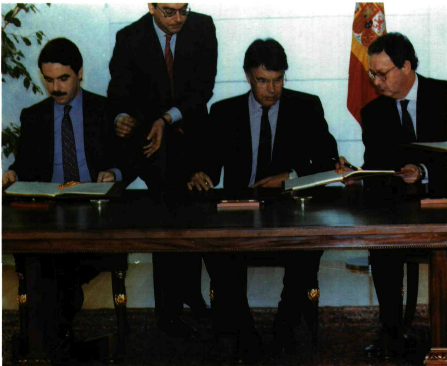
El presidente Felipe González y el líder del Partido Popular, José M a Aznar, firman el Pacto Autonómico.

o de vía lenta como los demás, se aprobaron a medida que estuvieron listos en varios bloques: tres el 30 de diciembre del 81; tres más entre junio y julio del 82; otros tres, y el Amejoramiento de Fuero de Navarra, que desempeña análogas funciones en esa región, en agosto del 82 y, finalmente, los cuatro restantes (entre ellos el de Madrid) el 25 de febrero del 83.