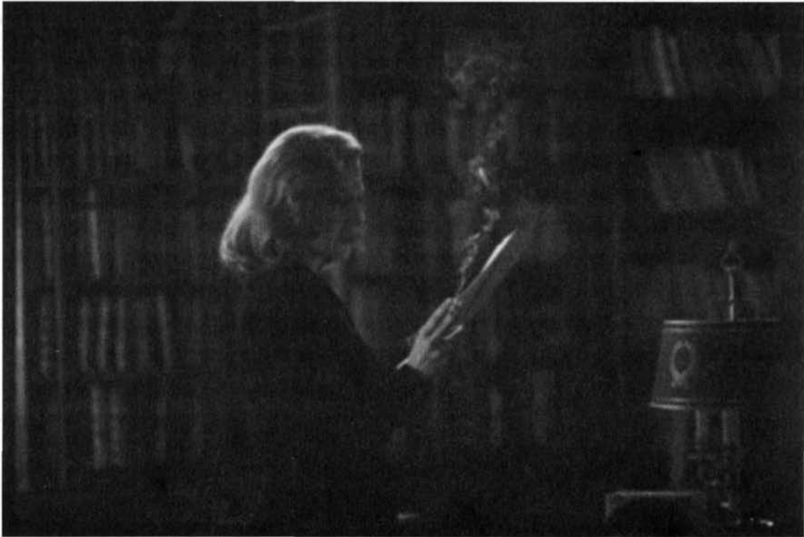
Gerardo Vera: Deseo (2002)