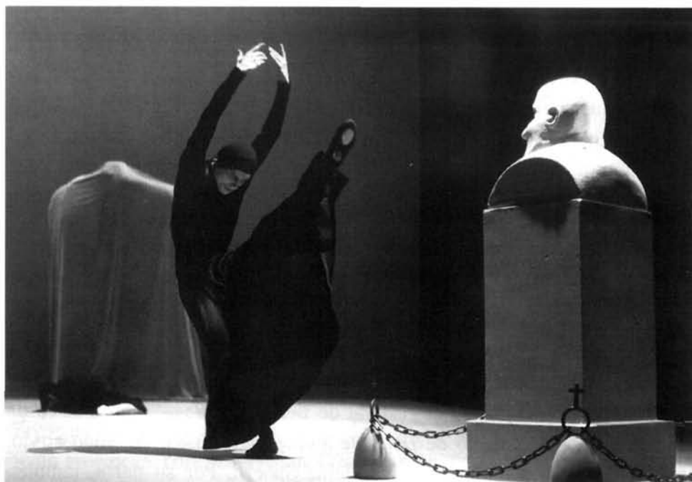
Otra escena del mismo ballet