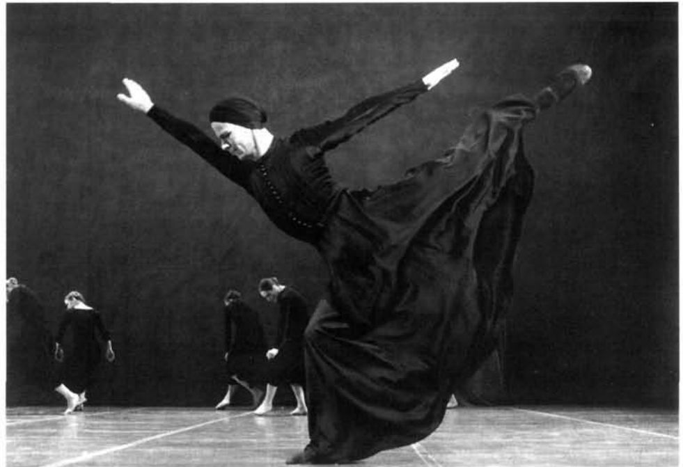
Escena del ballet La casa de Bernarda Alba , de Mats Ek.