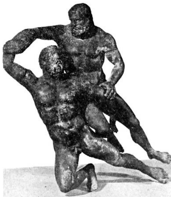
Fig. 24.- Heraklés y Antaíos. Bronce de Lixus hallado con los de las figuras 22 y 29 y conservado, como los otros, en el Mus. Arq. de Tetuán.