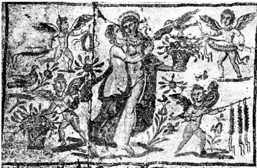
Fig. 27.- Diónyosos y Ariadna (?). Mosaico de Lixus (Larache). Mus. Arq. de Tetuán.