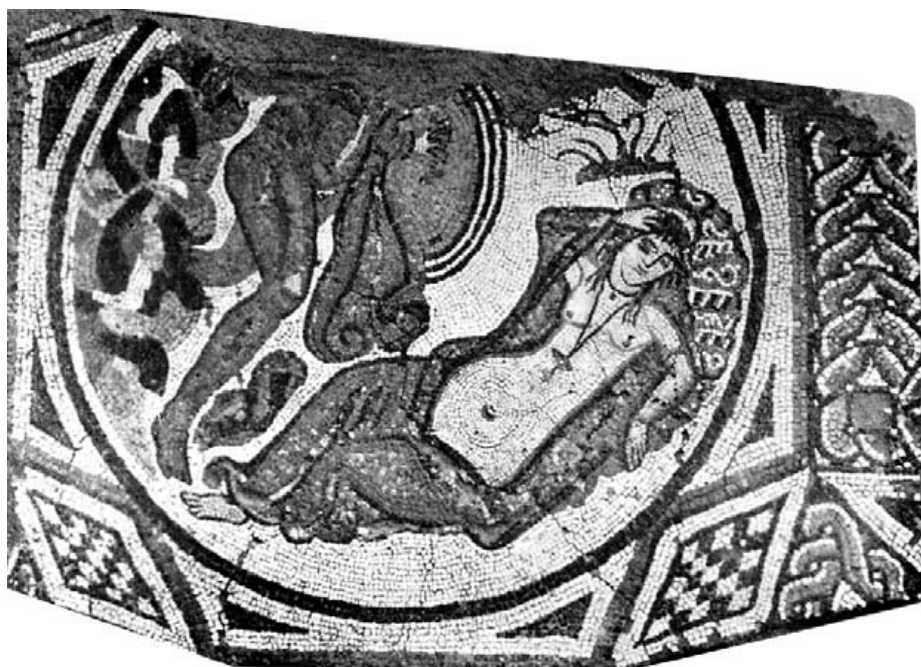
Fig. 26.- Emblema del mosaico de la fig. 25.