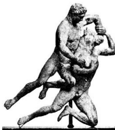
Theseús y Minótauros. Antiquarium de Berlín.