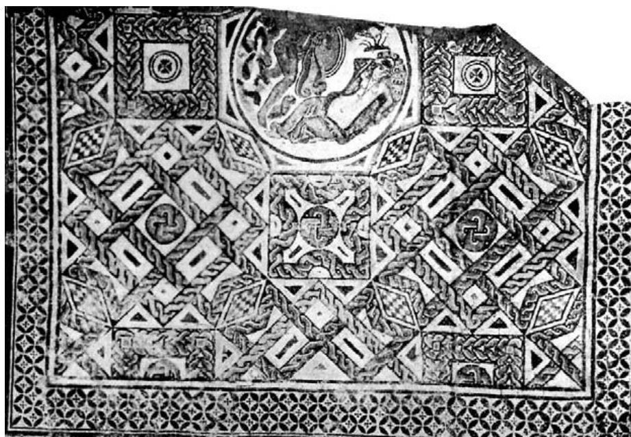
Fig. 25.- Gran mosaico de Rhea y Mars. Procede de Lixus (Larache). Mus. Arq. de Tetuán.