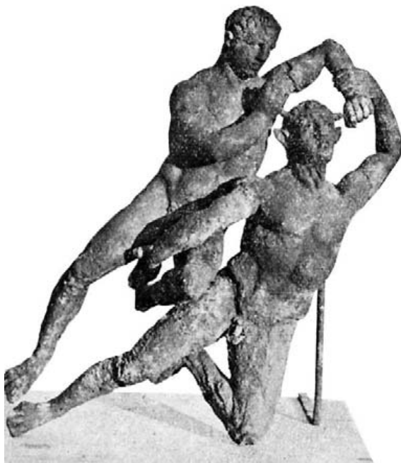
Fig. 22.- Theseús y Minótauros. Museo Fig. 22.- de Tetuán.