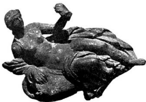
Fig. 29.- Leda y el cisne. Bronce hallado en Lixus con los de las figuras 22 y 24. Mus. Arq. de Tetuán.