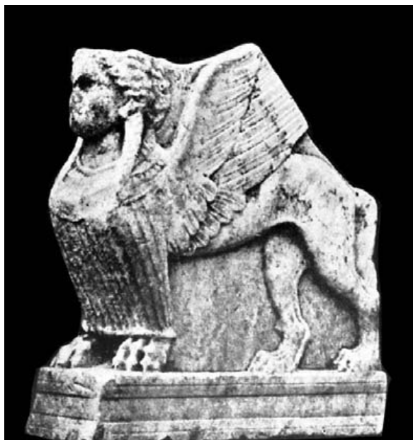
Fig. 28.- Esfinge de Lixus (Larache). Mus. Arq. de Tetuán.