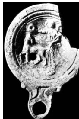
Fig. 30.- Lámpara de Lixus .