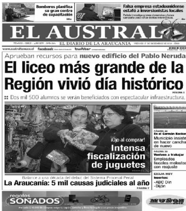
Fotografía 4: portada del 2010

Finalmente, es preciso señalar que todos estos avances tecnológicos que condicionan la nueva forma en que se presentan los textos informativos en El Austral , no hubieran podido ser desarrollados sin la presencia de una matriz cultural informativa que condiciona en gran medida nuestras formas de interpretar, mirar y dar sentido a las portadas de los periódicos.