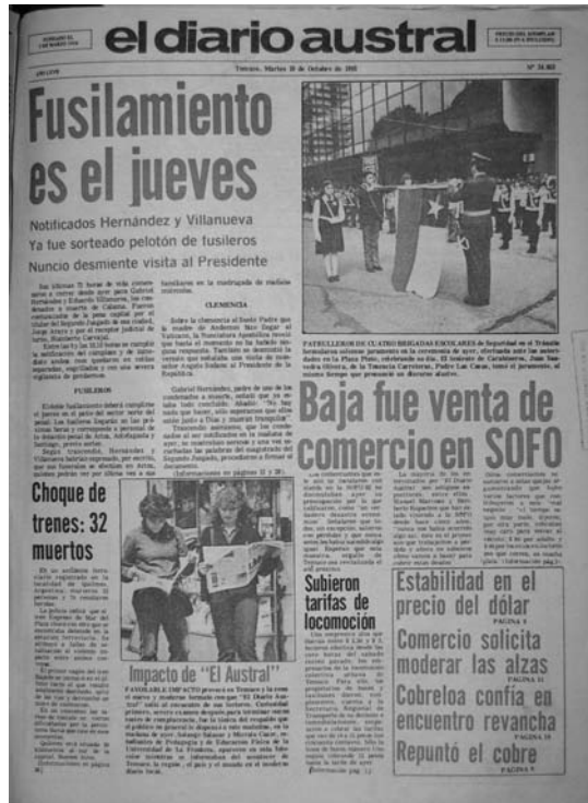
Fotografía 3: portada de 1982

En este sentido, retomamos lo planteado por Abril al acuñar el concepto de espacio sinóptico, el cual supone de una mirada integradora de los diferentes componentes visuales de la página que al ser recepcionados por los lectores, causan un estímulo determinado, en el caso de el diario, la compra del ejemplar, transformándose la lectura en una interpretación acción (ver fotografía 3):