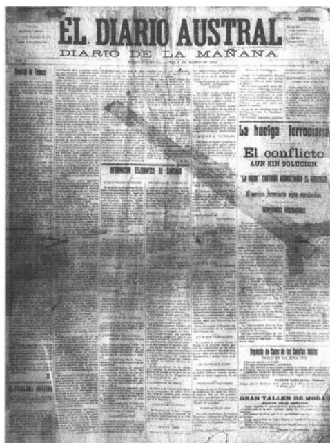
Fotografía 1: portada de 1916

Como resultado de la aplicación de la plantilla de análisis de contenido en las portadas, podemos identificar que éstas están compuestas principalmente por una gran cantidad de textos, los cuales presentan un extenso desarrollo, por lo que la información escrita abarca la mayor parte de la página, presentándose de una forma lineal. Ésta es una condición característica de los textos narrativos, puesto que necesitan de la argumentación de su contenido para otorgarle sentido y validez a la información. A su vez, estos textos deben su forma a las prácticas de la oralidad que supone de la sucesión de los acontecimientos en el tiempo, como señala Gonzalo Abril, proponiendo una estructura y una lectura de tipo lineal.