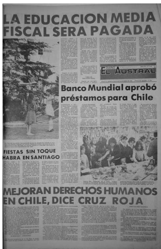
Fotografía 2: portada de 1976

1976 marca un hito fundamental en el desarrollo tecnológico del diario, puesto que se incorpora el sistema de impresión offset ; imprenta de marca Cotrell, fabricada en Estados Unidos, que consta de seis unidades que pueden imprimir un diario tamaño estándar, pudiendo realizar impresiones en blanco y negro, a dos colores y a todo color. Si bien es cierto, la presencia del color y de la fotografía, es posible identificarlas esporádicamente con anterioridad (ver fotografía 2):