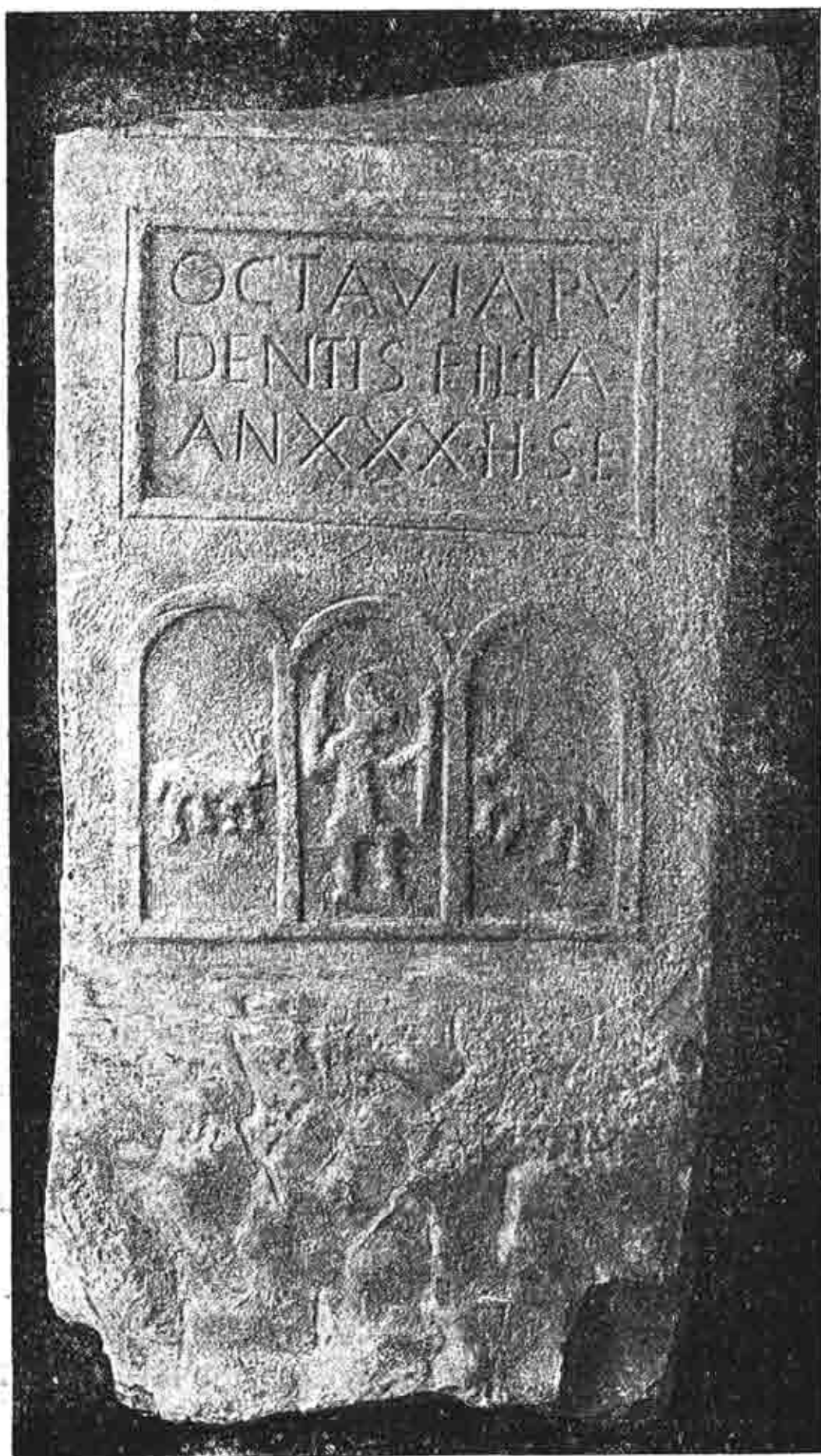
ESTELA DE VILLATUERTA