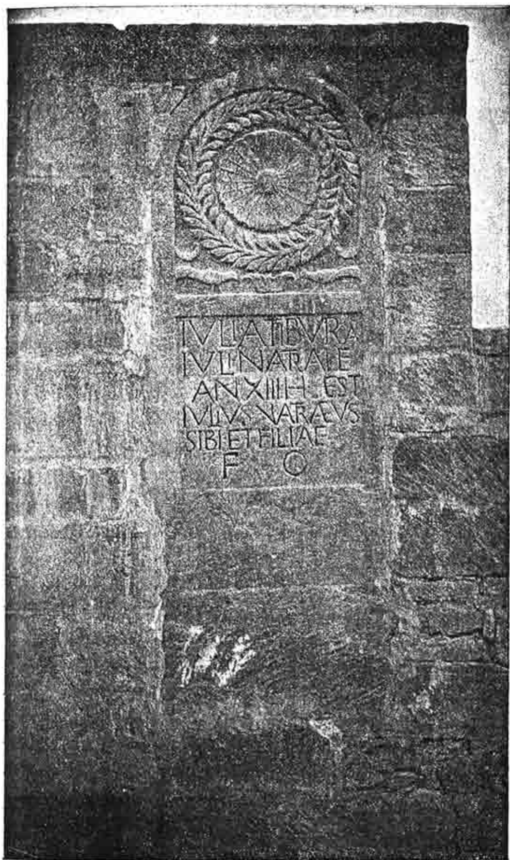
ESTELA DE ALBERITE