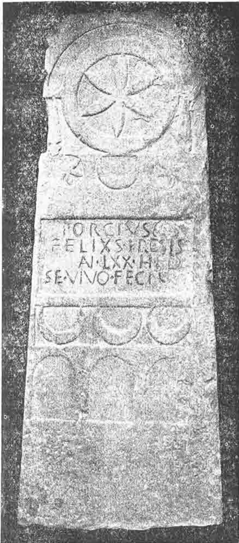
ESTELA DE CARCASTILLO