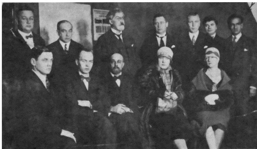
Vallejo en una reunión de escritores soviéticos, Moscú 1928