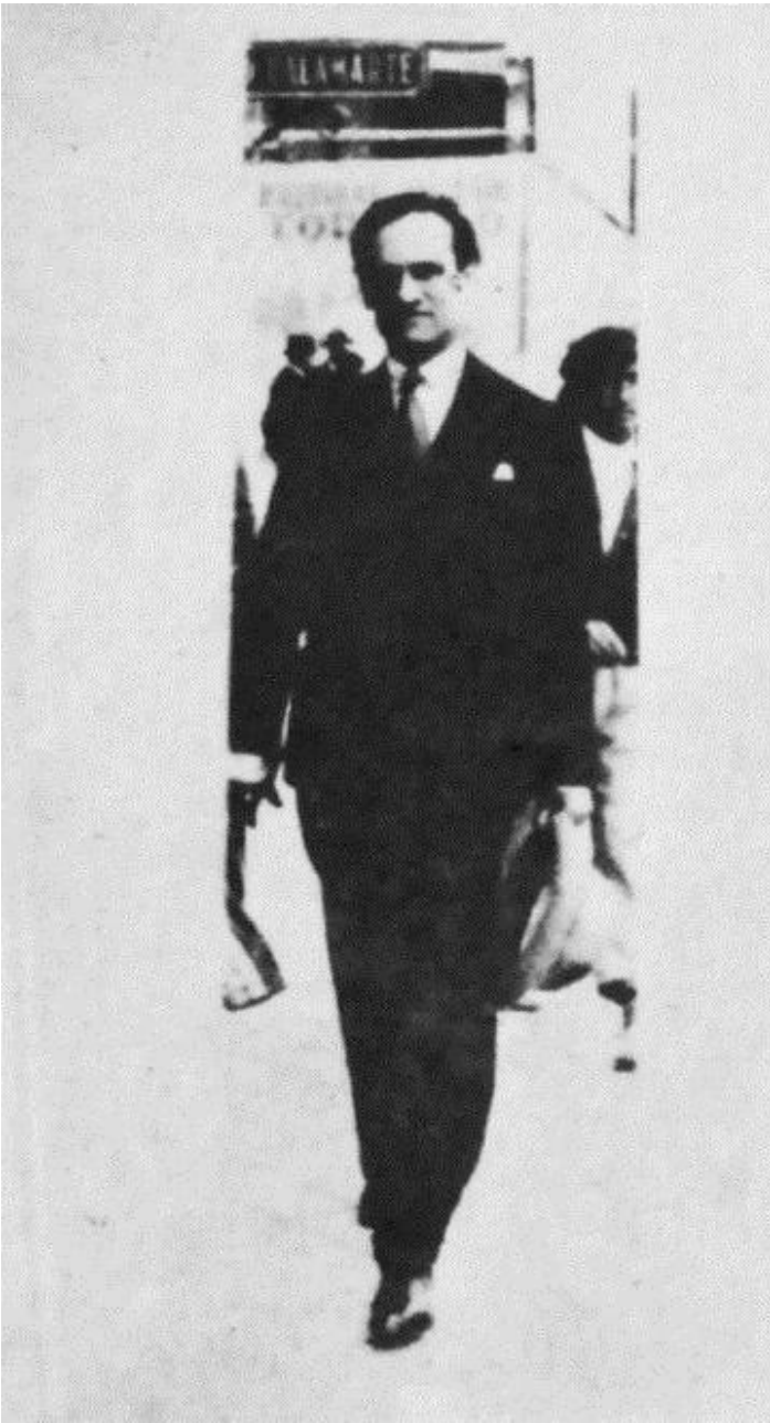
César Vallejo en una calle parisina.