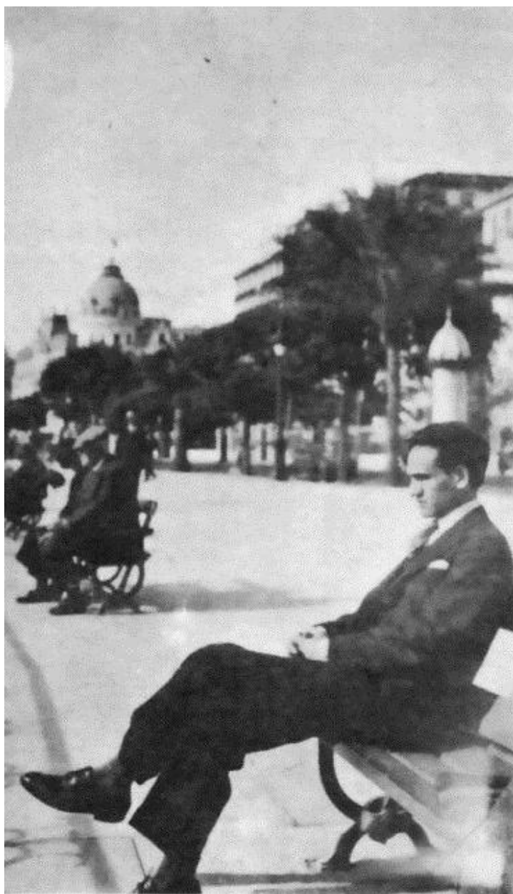
César Vallejo en París, 1924.