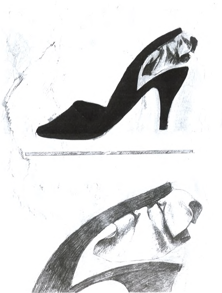
La tela del telón del talón.