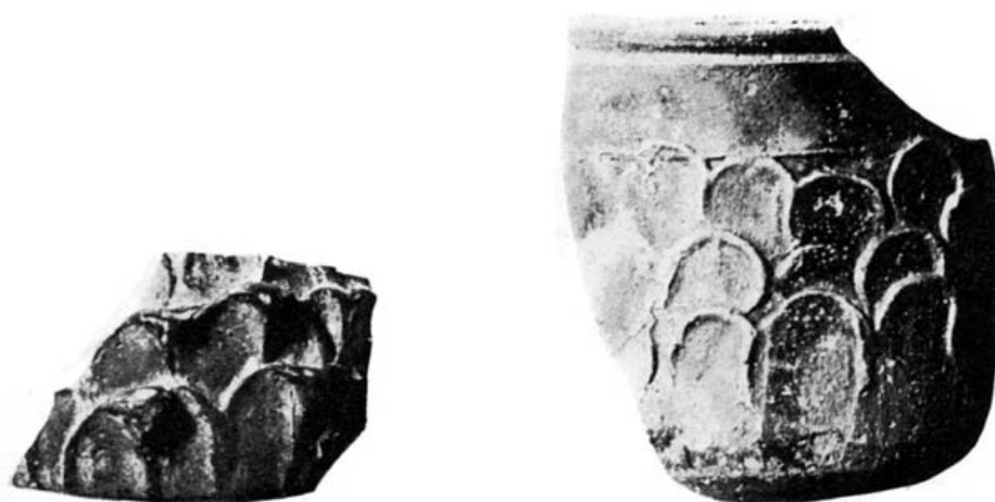
FIG. 6. Fragmentos de cerámica a la barbotina.

Continuamos nuestra descripción con los cinco fragmentos cerámicos encontrados junto a la urna funeraria. Todos ellos presentan una decoración a la barbotina por la que pueden ser fechados en torno a la segunda mitad del siglo I después de Cristo.