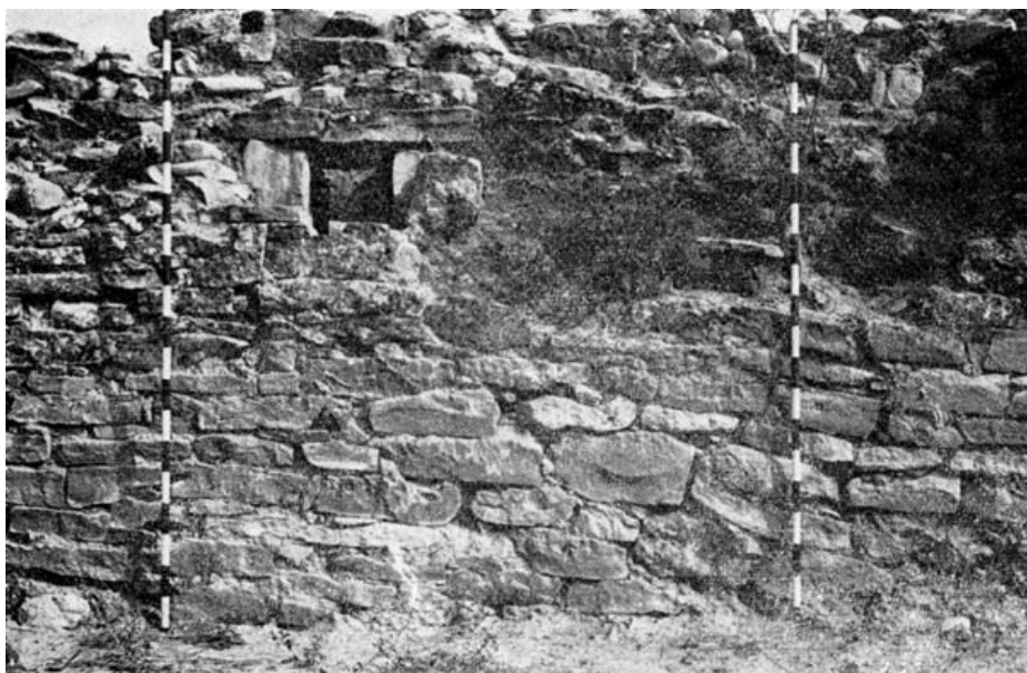
FIG. 1. Cara exterior de la muralla de Cástulo. A 90 cm. hacia el camino, enfrente del punto señalado, se encontró la urna pintada.

ponemos publicar unas cuantas tumbas, que se pueden fechar con seguridad por el material acompañante, donde aparezcan urnas pintadas, que se daten en el espacio de tiempo comprendido entre comienzos del Helenismo y el s. IV, para poder comprobar que la tradición de la pintura no se perdió totalmente en época imperial 5 .