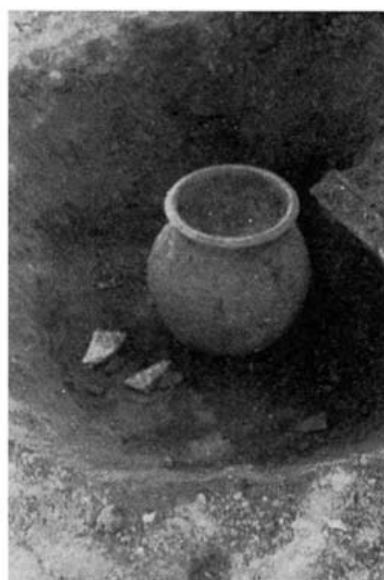
FIGS. 2 a 4. Diversos aspectos de la urna funeraria encontrada en la muralla de Cástulo.

El cuello es de forma de tulipa invertida y su estrechamiento aumenta la separación entre panza y boca.