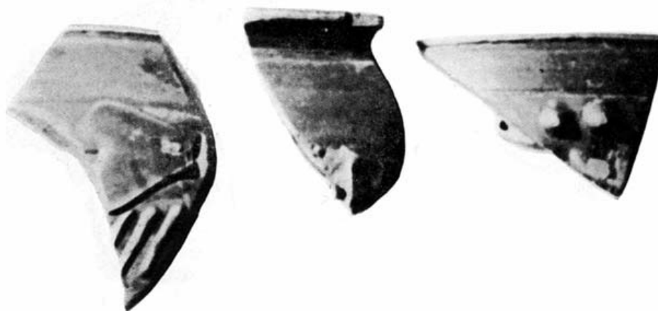
FIG. 7. Fragmentos de cerámica a la barbotina.

Fragmento de borde de vaso hecho a torno, cuyas huellas se acusan tanto en el interior como en el exterior.