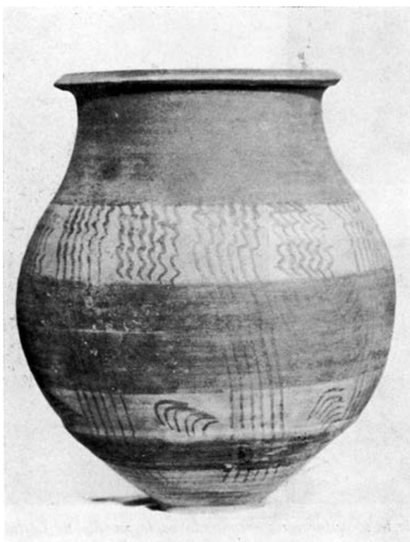
FIG. 5. Urna con pintura.

La 2. a de 20 cm. de ancho está situada en el centro de la panza.