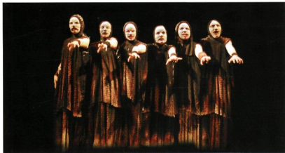
Contempla, espectador, una de las máquinas más perfectas construidas por los dioses infernales para la aniquilación matemática de un mortal.