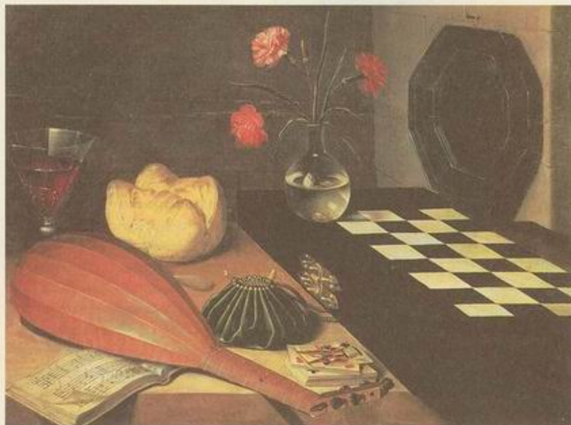
Lubin Baugin Naturaleza muerta con laúd

Nos encanta ser un instrumento de la Cultura