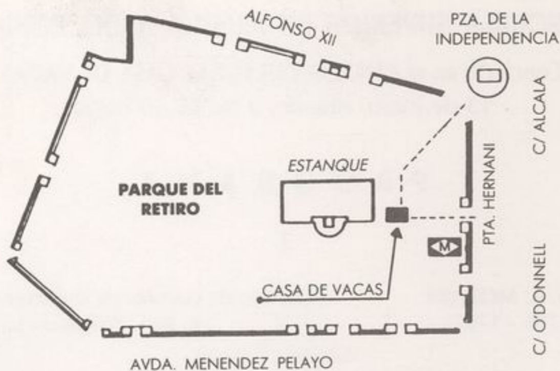
Plano de acceso al C.C. "Casa de Vacas"