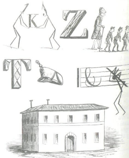
La solucion en el número próximo.