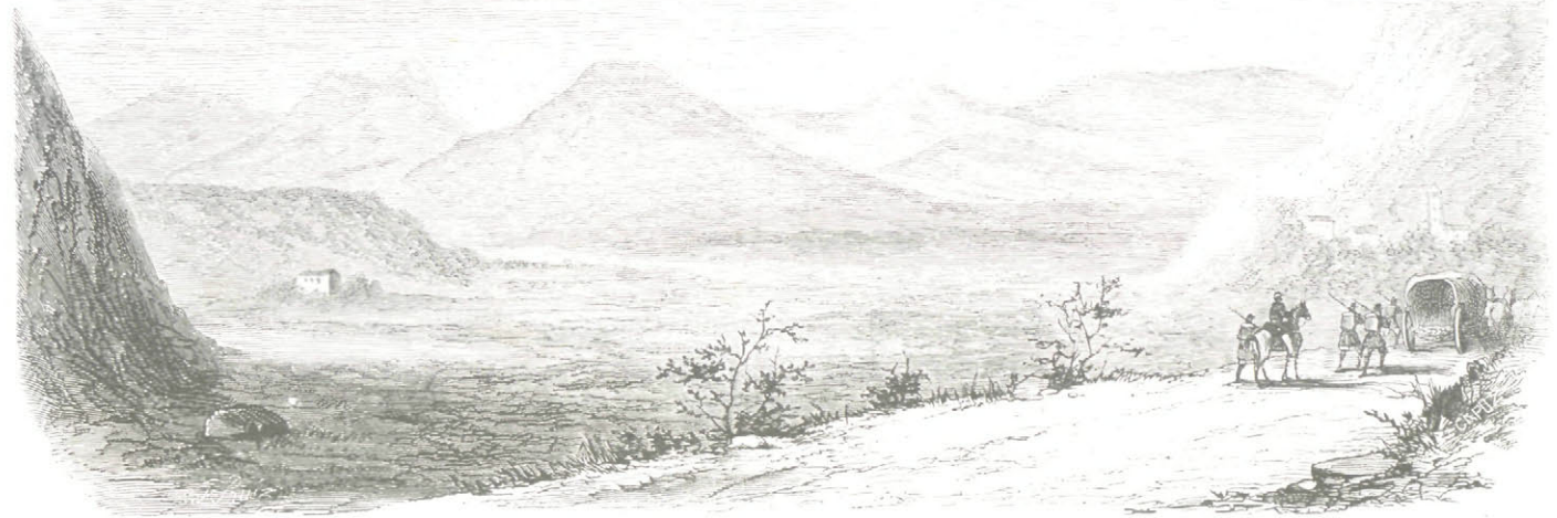
MEXICO. — CAMPIÑA DE ORIZABA (CAMINO DE CORTOBA).