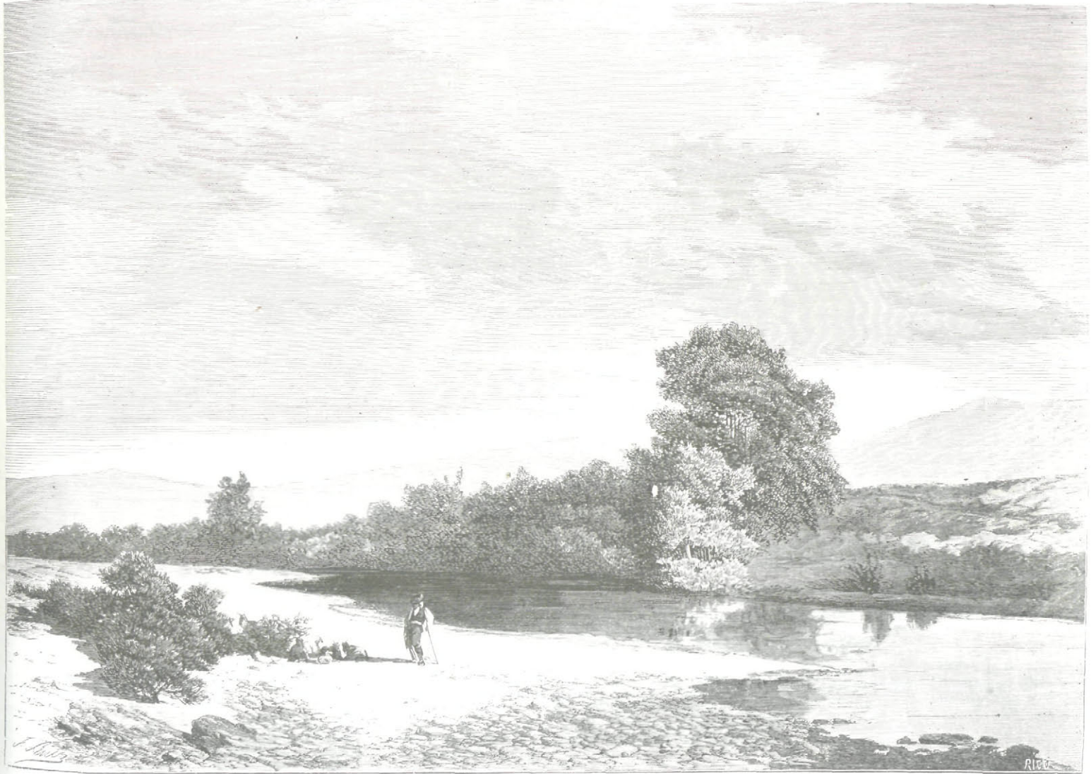
CUADRO DE DON CARLOS HAES, PREMIADO EN LA ÚLTIMA ESPOSICION.

Los godos permanecieron por muchos años alejados de aquellas costas y es de creer que hasta después de Suintila apenas tuvieron roce con ellos contentándose al fin de su dominación con tenerlos como los romanos por sus amigos y aliados, pues estos conquistadores imitaron siempre las costumbres de los antiguos dueños del país en aquello que no contrariaba las suyas. El influjo de los godos se dejó sentir en Asturias en la época de Chindasvinto á la que según presumo pertenece el templo de Santa Cristina, situado á la falda Occidental del Medulia, pues los caracteres de su inscripción se parecen mucho á los que tienen las coronas votivas encontradas en Guarrazar al paso que los templos edificados por los tres primeros Alfonso son