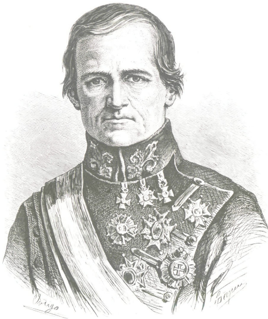
EL GENERAL DON JOSÉ MANSO.

Así es que estos pueblos hacian con los romanos un gran comercio en vermellon, cinabrio y oro. No se crea que antes de la dominación romana desconocieron la explotación de las minas como algun autor antiguo asegura, pues, consta las beneficiaban en época mas antigua, y me inclino á creer que los fenicios de Gades sacaron de aquel país inmensas cantidades de oro y estaño, según lo acreditan los trabajos modernos,