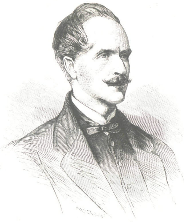
EL GENERAL MENABREA.

La mujer honrada , dice un antiguo refran, la pierda quebrada y en casa . Pero ¿quién hace caso de