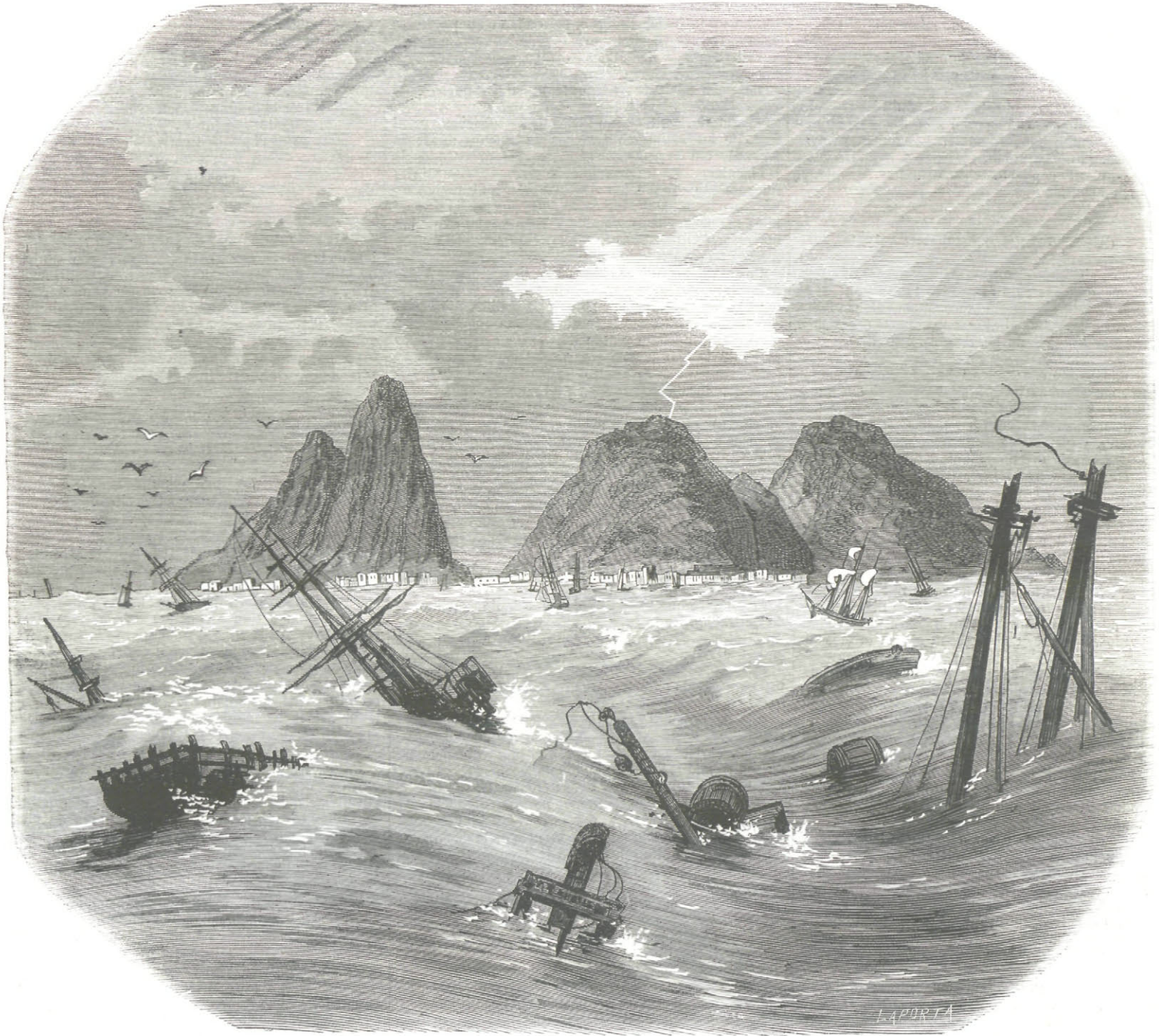
SUMERSION DE LA ISLA DE TORTOLA.

Escusado es decir que el comercio ha sufrido pérdidas incalculables, y que la paralización de los negocios ha sido completa por espacio de muchos días.